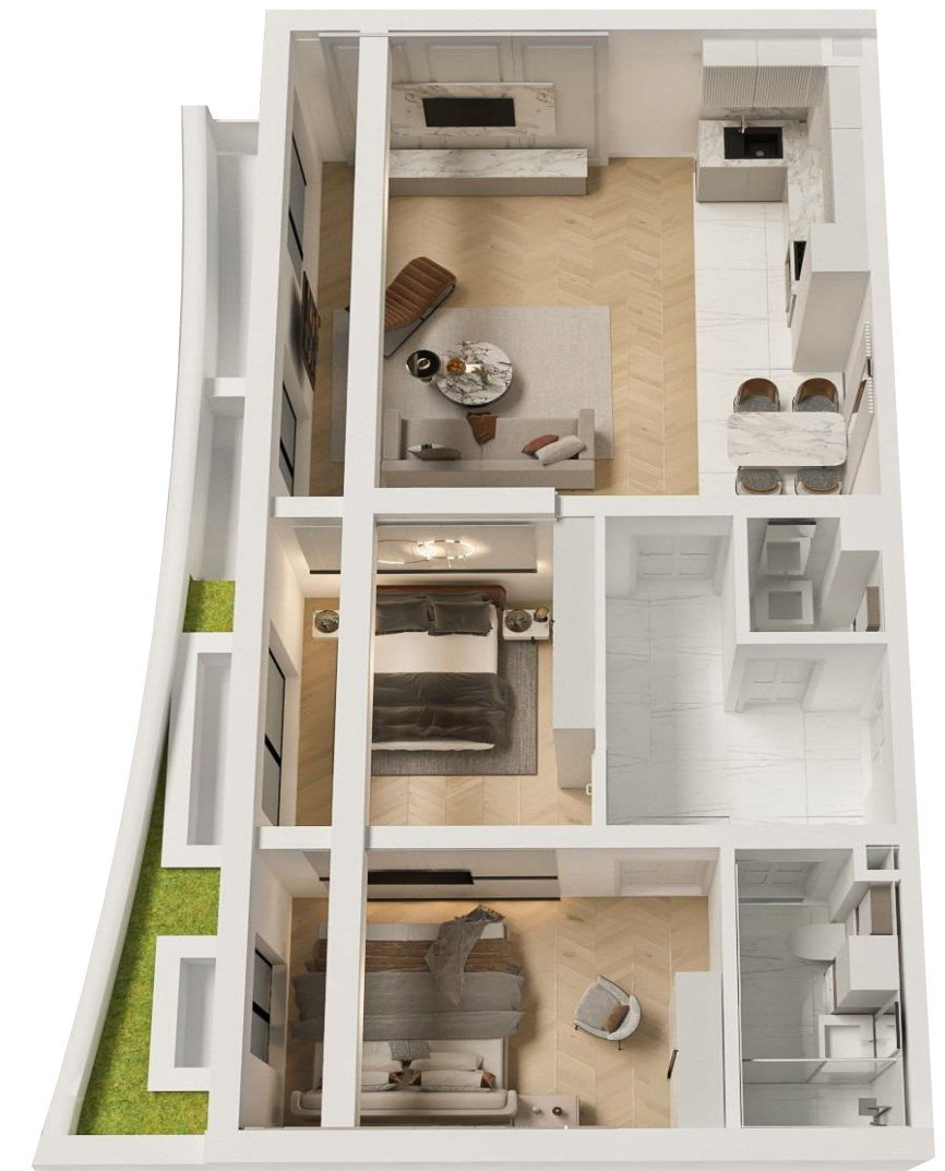
3D MODEL STANA